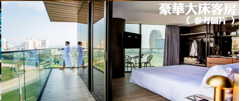
豪華大床客房 (參考圖片)