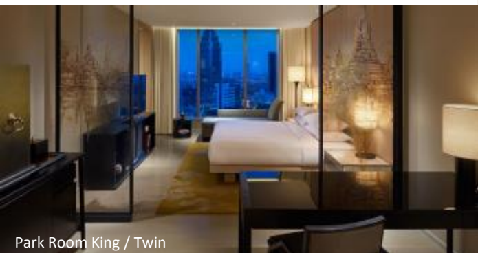
Park Room King / Twin