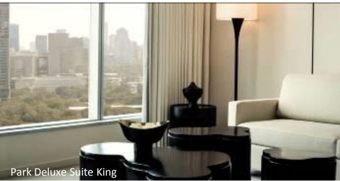
Park Deluxe Suite King