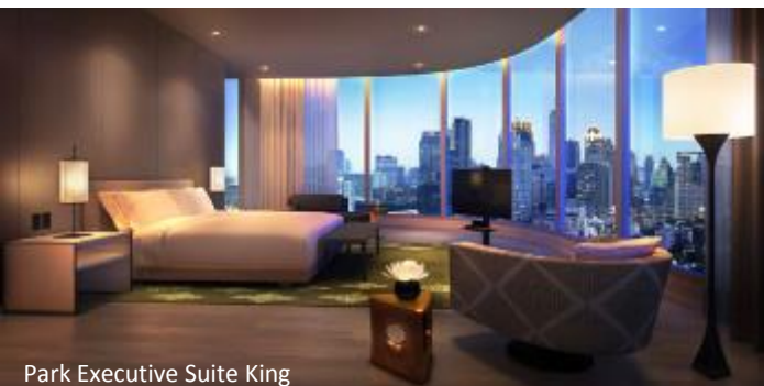
Park Executive Suite King

Park Room / Park Deluxe Room 最多可住: 3位成人 / 2位成人 + 1位小童; 所有 Suites 房最多可住: 3位成人 / 2位成人 + 2位小童